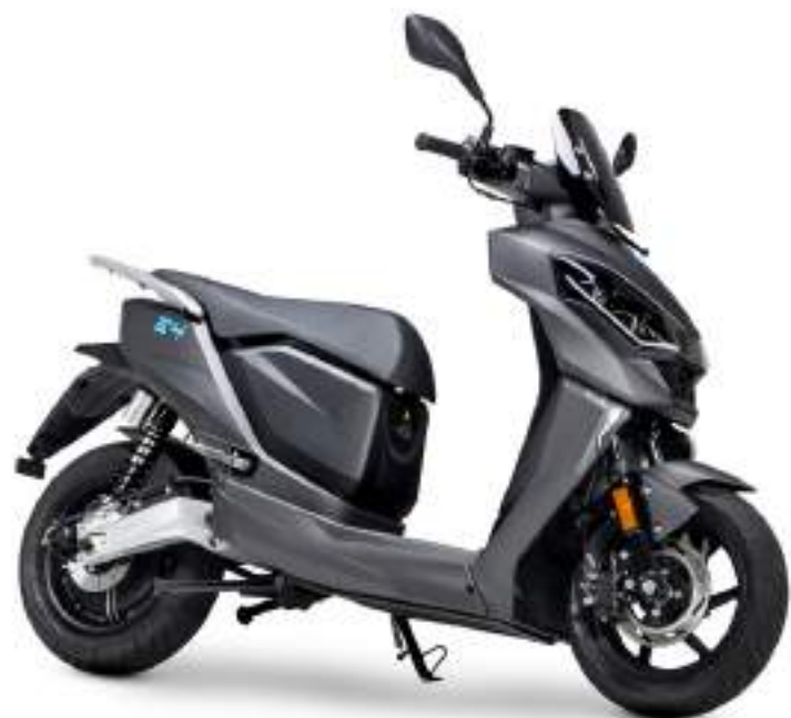
GRAPHITE GRAY OPACO